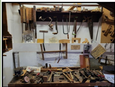
Einblick in den Museumsbereich Schreinerhandwerk

Die Heimatstube Obertiefenbach ist am Sonntag, dem 14. Dezember 2025 , von 14:00 bis 16:00 Uhr geöffnet. Im Pfarrheim Alte Schule ist auf einer Fläche von rund 190 m 2 die seit 27 Jahren bestehende heimatgeschichtliche Dauerausstellung des Kath. Männerwerks St. Ägidius im Dachgeschoss zu besichtigen. Eintritt wird nicht erhoben.